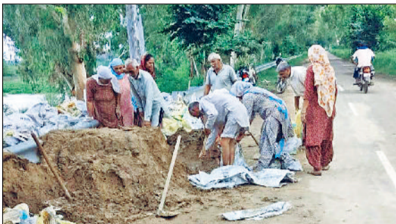
सिरसा। घग्गर के तटबंधों पर बसे गांवों के लोग मिट्टी से भरे प्लास्टिक के गट्टे लगाकर बाढ़ से बचाव करते हुए।

पहाड़ों में हो रही बरसात के चलते मंगलवार को घग्गर के जलस्तर में बढ़ोतरी देखी गई। पंजाब के सरदूलगढ़ क्षेत्र से सुबह 26400 क्यूसिक पानी था जो शाम को बढ़ कर 28040 क्यूसिक पहुंच गया। सिरसा के ओट्टू में भी 17500 क्यूसिक पानी चल रहा है। घग्गर नदी के जलस्तर और तटबंधों की सुरक्षा को लेकर जिला प्रशासन पूरी तरह से सतर्क है। जहां सिंचाई विभाग की टीम दिनरात निगरानी कर रही है, वहीं प्रशासनिक अधिकारी भी निरीक्षण कर पुख्ता प्रबंध सुनिश्चित कर रहे हैं और ग्रामीण भी पूरा सहयोग कर रहे हैं। इसके अलावा खरीफ चैनल और ड्रेन आदि पर भी निगरानी रखी जा रही है। घग्गर नदी में जलस्तर की स्थिति देखें तो दोपहर 12 बजे तक सरदूलगढ़ पॉइंट पर 27600 व ओट्टू विनार डाउन स्ट्रीम में 17500