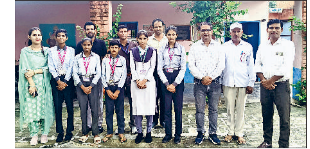
सिरसा। विजेता खिलाड़ियों को सम्मानित करते हुए।