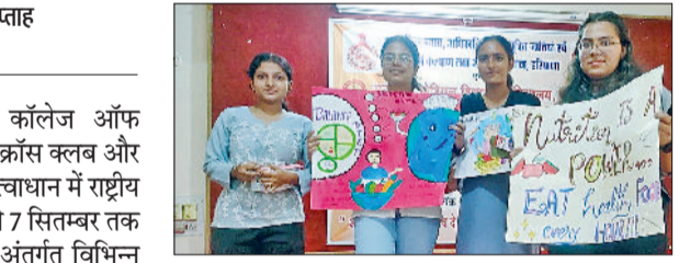
पोस्टर मेकिंग प्रतियोगिता में भाग लेती कॉलेज की छात्राएं।