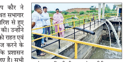
फतेहाबाद। चिल्ली झील पर बने एसटीपी का निरीक्षण करती उपायुक्त मनदीप कौर।

फतेहाबाद। उपायुक्त मनदीप कौर ने मंगलवार को लघु सचिवालय स्थित सभागार में जिला अधिकारियों के साथ बारिश से हुए जलभराव की स्थिति पर समीक्षा की। उन्होंने संबंधित विभागों के अधिकारियों को राहत एवं बचाव कार्यों को और अधिक तेज करने के निर्देश दिए। उपायुक्त ने कहा कि प्रशासन लगातार हालात पर नजर बनाए हुए है। सभी विभाग आपसी समन्वय के साथ कार्य करें, ताकि किसी भी नागरिक को परेशानी का सामना न करना पड़े। उपायुक्त ने सभी बीडीपीओ को निर्देश दिए कि भविष्य में जिन गांवों में पानी भरने की संभावना हो, वहां तत्काल सैंड बैग लगाकर रिग बांध बनाए, जिससे आबादी पूरी तरह सुरक्षित रह सके। साथ ही, जिला परिषद सीईओ को आदेश दिए गए कि वे प्रतिदिन रिपोर्ट लेकर फीडबैक सुनिश्चित करें और जहां भी पानी आबादी में घुसने का खतरा हो, वहां तुरंत निकासी की व्यवस्था की जाए। डीएफएससी को निर्देश दिए गए कि वेयरहाउस और भंडारण स्थलों की सुरक्षा व्यवस्था पुख्ता रखी जाए तथा