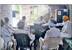
हरिभूमि न्यूज ▶ फतेहाबाद

भाजपा सरकार भ्रष्टाचार की आड़ में मनरेगा को खत्म करने पर तुली हुई है। भाजपा सरकार की नीति और नीयत ठीक हो तो मनरेगा कानून ग्रामीण विकास एवं मजदूरों के रोजगार के लिए कारगर साबित हो सकता है लेकिन शासन और प्रशासन की मिलीभगत से मनरेगा को खत्म करने का पड़यंत्र रचा जा रहा है, जिसे किसी भी स्तर में बर्दाश्त नहीं किया जा सकता। यह बात अखिल भारतीय खेत मजदूर यूनियन हरियाणा के उपाध्यक्ष