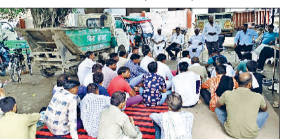
फतेहाबाद। नगरपालिका कर्मचारी संघ की बैठक में भाग लेते कर्मचारी।